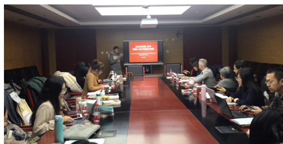
2020.1.7 · 北京