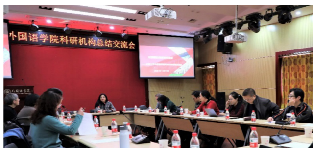
2020.1.9 · 北京

1月9日，“对接国家战略智库建设——北京大学外国语学院科研机构总结交流会”在外院新楼501会议室召开。社科院王栋副部长、学院宁琦院长及二十余位学院科研机构负责人出席会议。参会人员就研究机构的近期重要工作、智库工作的开展情况等进行了交流与探讨。会议由学院副院长吴杰伟教授主持。