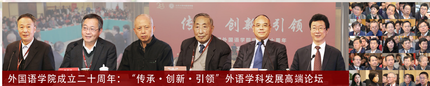
外国语学院成立二十周年：“传承·创新·引领”外语学科发展高端论坛

11月17日上午，由北京大学外国语学院主办的“传承·创新·引领”外语学科发展高层论坛在北京大学正大国际中心弘雅厅顺利召开。上海外国语大学、四川外国语大学、西安外国语大学、天津外国语大学、北京第二外国语学院、云南大学、扬州大学、闽南师范大学等8所高校的校领导，清华大学、复旦大学、上海交通大学、南京大学、浙江大学、北京外国语大学等53所高校的外语学科负责人、学者代表，十余所国内外外国语学校的代表，北京大学外国语学院师生共计160余人齐聚一堂，深入研讨如何在构建人类命运共同体理念引领下建设中国外语学科，以更好地应对人才培养与学术话语创新这一重大课题。